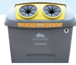
Papera eta kartoia